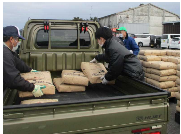
消石灰配布時の防疫指導