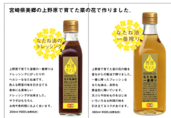
【新たに開発された地域特産品】