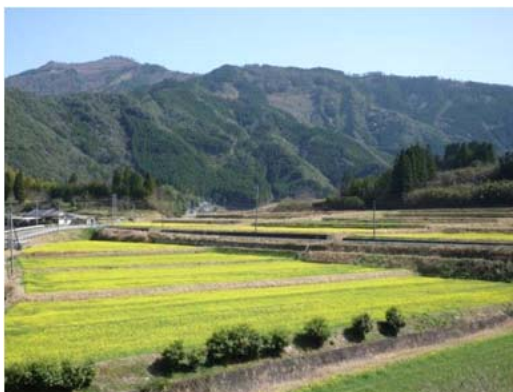
【集落内農地へのナタネ作付状況】

また、平成21年度より、傾斜地の草管理と景観づくりを目的にヤギを導入しており、今後、近隣集落へのヤギのレンタル事業や山羊乳を原料としたアイスクリーム等新たな地域特産品の開発に取り組むこととしている。