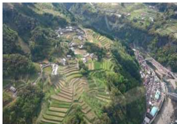
【日之影町の農用地】