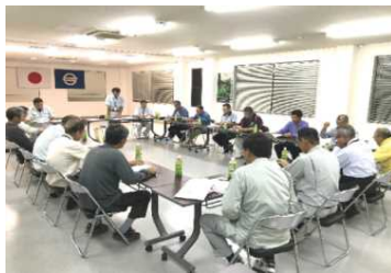
【広域化に向けた話し合い状況】