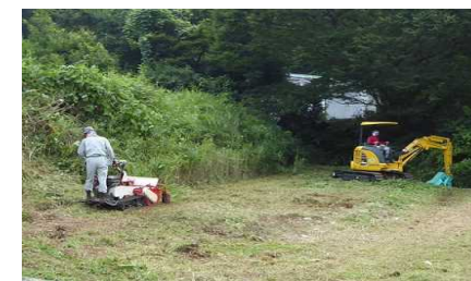
【法人による休耕田の復旧作業】