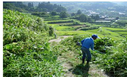
【町内の農用地は小面積で階段状】