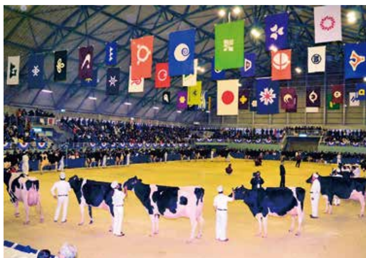
【前回大会（北海道大会 H27年）の様子】