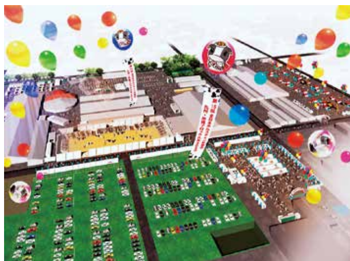
【大会会場のイメージ】