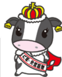
ホルスタイン共進会 マスケットキャラクター 南風ミル