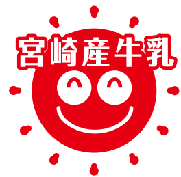
「宮崎産牛乳」ロゴマーク

2020年10月31日(土)～11月2日(月)に、都城市をメイン会場に「第15回全日本ホルスタイン共進会九州・沖縄ブロック大会」が開催されます。 この機会に、宮崎県産牛乳をぜひ飲んでみてください！