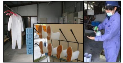
専用の服や靴の使用、手指消毒