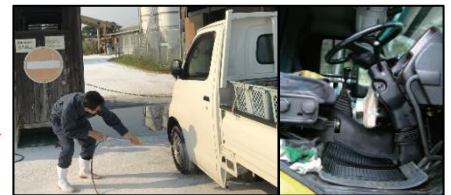
車両はタイヤだけでなく、 泥よけの内側まで消毒 し、 フロアマットの交換 や ペダル等車内も消毒