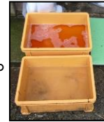
推奨される踏込消毒槽の設置方法！