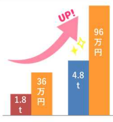
収量向上技術のマニュアル化