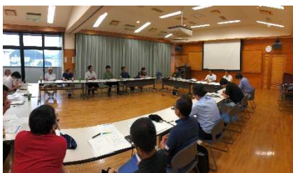
畑かんマイスターとのネットワークの構築