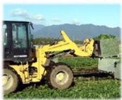
ホイールローダー

○汎用性が高いなど国庫事業では導入できない、コスト削減に効果的な機械導入に係る経費を支援