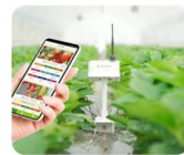
【環境モニタリング機】