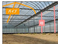
【柱・パイプの交換】