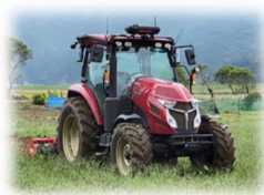
省エネトラクター