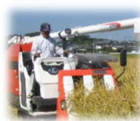
高性能コンバイン