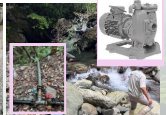
用水確保のための ポンプ・ホース等