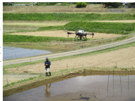
【ドローンによる水稲直播(高千穂町下野)】

今後、播種後の水管理や雑草防除など細かな技術的ポイントを確認しながら、生育ステージに合わせ技術支援や技術マニュアルの改訂を行います。