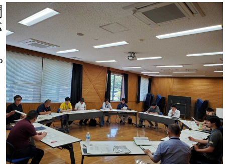
【担い手関係担当者会】

今後も関係機関・団体との連携を継続し、地域一体となった新規就農者の確保や育成に取り組んでいきます。