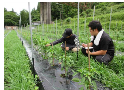
【JA担当者との生育確認】

今後もきめ細かな生育確認を継続し、産地全体での安定生産に向け、JAと連携し支援していきます。