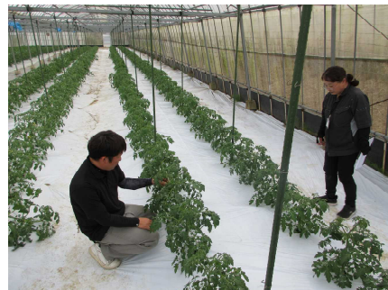
【JA担当者とミニトマトの生育確認】

今後は、時期に応じた適切な栽培管理を促すとともに、産地全体の安定的かつ持続的な生産体制の確立に向け、JAと連携し支援していきます。