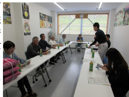
【スイートピー部会実績検討会】