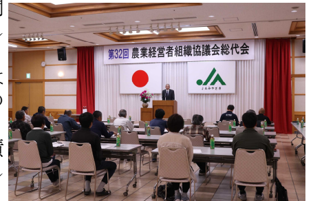
【高千穂地区農業経営者組織協議会 総代会】

今後も引き続き、関係機関・団体との連携し、農業経営に関する支援を行っていきます。