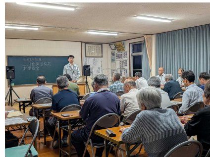
【上川登集落協定期総会】

今後も、集落における活動の活性化に向け、関係機関と連携しながら支援を継続してまいります。