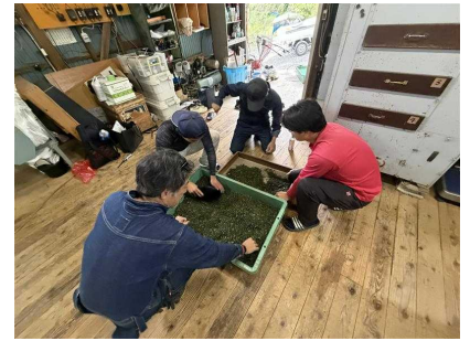
【参入法人への一番茶製造支援】

普及センターでは、地域の担い手不足解消と産地維持を目指し、今後も同法人の定着に向け、引き続き支援していきます。