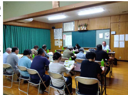
【鳥獣害被害対策の地区協議】

※特命チーム：各町、JA高千穂地区本部、森林組合、NOSA I、西臼杵支庁(事務局：農政水産課)で構成