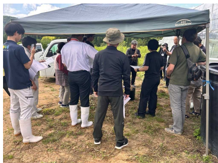
【ラナンキュラス部会の現地研修会】

今年度も産地一丸となって、高品質なラナンキュラスを生産できるよう栽培技術の向上に取り組んでいきます。