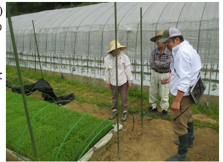
【育苗指導(高千穂町)】

今後は、田植え後の水管理が重要となる時期となることから、安定生産に向け、引き続き支援していきます。