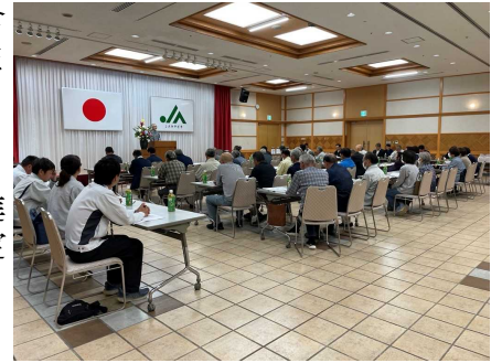
【高千穂地区果樹振興会定期総会】