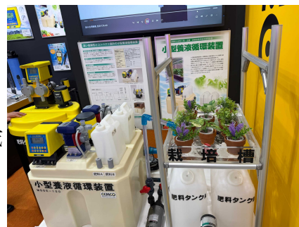
【九州農業WEEK 最先端技術の展示】

今回得た情報や知見については、今後の営農支援活動や地域農業の課題解決に積極的に活用してまいります。