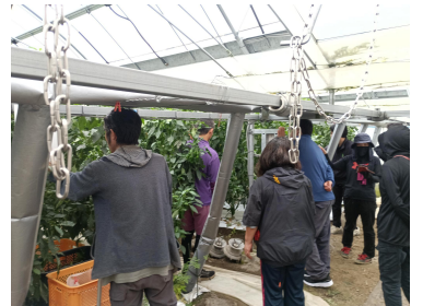
【現地検討会の様子】

23日にJAみやざき西都地区本部ピーマン部会の新規就農者グループの現地検討会が開催され、生産者7名、JA指導員、普及センターが参加し、4戸のは場を巡回しました。各は場を巡回しながら、草姿や管理方法に関する意見交換が生産者同士で行われました。今作の現地検討会は今回が最後ですが、作終了時の地下部の状況確認のための掘り取り調査など、引き続き、新規就農者の学修グループの活動支援を行っていきます。