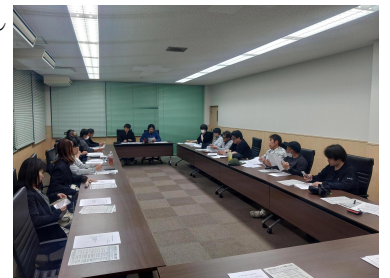
【高鍋町SAP会議総会の様子】