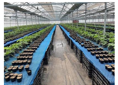
【検定用の葉を採取した1ほ場】

JAと普及センターで、いちご親株の炭そ病検定を実施しました。1日の葉の回収日には、6戸の熱心な生産者が葉を持ちこみ、検定を依頼されました。検定の結果複数の潜在感染が確認されたため、生産者には感染株の除去や対策の強化を依頼しました。今後も月一回程度の検定を行い、炭そ病撲滅に向けた支援を行っていきます。