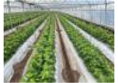
【ホオズキの生育状況】

木城町では2戸の生産者がホオズキを栽培していますが、23日段階で開花も始まり、マルハナバチの放飼も開始されています。一部でハダニの発生も見られますが、概ね生育は順調です。今後も7～8月出荷に向けて、病害虫対策や実の着色に係る支援を行っていきます。