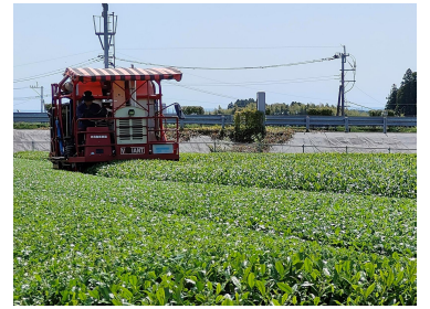
【一番茶摘採の様子】

令和8年産一番茶の収穫が4月下旬から本格化しています。今年冬場の干ばつや4月に入ってからの天候不順の影響により、一部の茶園では生育にややばらつきが見られるものの、全体としては順調に推移しています。生産現場では適期摘採による品質確保に取り組んでおり、児湯地域ならではの良質な新茶の出荷が期待されます。