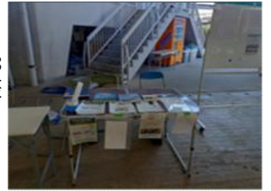
【相談窓口設置の様子】

7～8日に児湯地域家畜市場において開催されました。普及センターからは審査場においてセリ市研修会を実施し、ネズミ対策について話をしました。セリ市では、平均価格（売却）は去勢818千円、雌887千円でした。また、4月セリ市から普及センターと振興局で相談窓口を設置を開始しました。