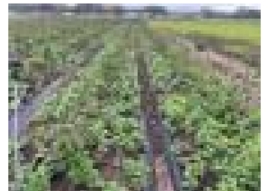
【ベビーハンズの生育状況】

西都市では3戸の生産者がベビーハンズを栽培しており、5月の母の日出荷に向けた作業が行われています。西都市三財で実施している、土壌改良材の展示ほにおいては、22日段階で展示区が対照区に比較して良好な生育となっています。今後も定期的な巡回支援を実施していきます。