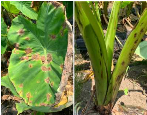
図1 確認された病斑（葉、葉柄）