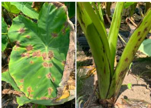
図1 感染した株の病斑（葉、葉柄）