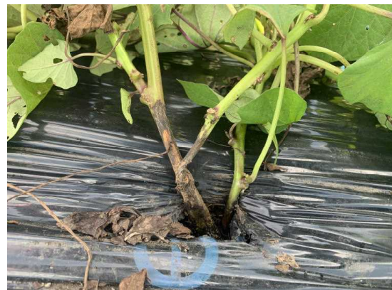
図1 発病株の病斑部(参考)

なお、フロンサイドSCを散布する際には茎葉だけでなく、通路を含めてほ場全体に散布し、通路の土壌からの感染を予防する。