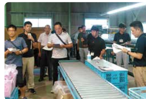
選果場を視察し質問をする参加者

GAPは無駄を無くすことによる所得の向上や安全・安心の確保だけでなく、マニュアル化による生産技術の継承にもつながるものだと思います。 今年は部会員が追加で認証を受ける予定です。