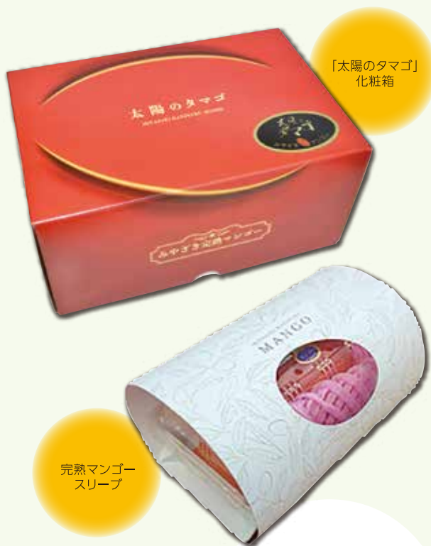
「太陽のタマゴ」化粧箱

「太陽のタマゴ」化粧箱のリニューアル(全JA統一デザイン)や、新しく作った完熟マンゴーのパック用スリーブで、贈答需要の拡大に取り組みました。