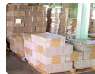
資材は床に直置きしない