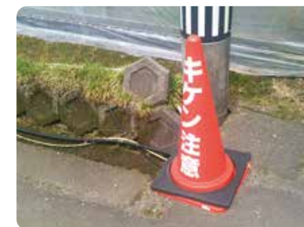
落下危険箇所の注意表示