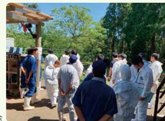
畜産GAP指導員研修会

指導員育成のための研修会を開催し、畜産GAPの普及・推進体制の強化を図っています。