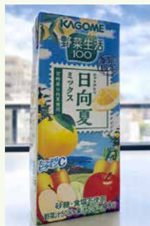
令和元年7月から全国販売「KAGOME野菜生活100 日向夏ミックス」