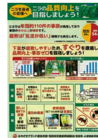
ニラ腐敗防止啓発ポスター