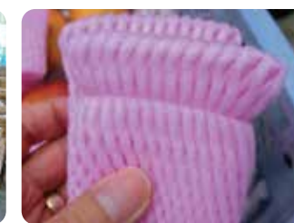
フルーツキャップの輪ゴムを予め除いて異物混入防止