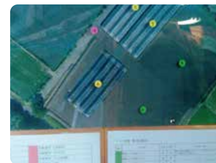
ほ場等のリスクを写真地図と併せて表示