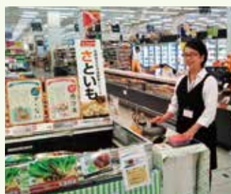
冷凍野菜の試食宣伝を開始

みやざきブランドの価値を共有するバリューチェーンパートナーとして10取引先を設定。トップ会談や特長ある商品の取り扱い増加、加工品を含めた総合品目販売を展開し、パートナーシップを強化していきます。