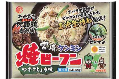
宮崎ケンミン焼ビーフン