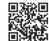
保健機能食品キャンペーンサイト

昨年12月に、関東を中心に展開する九州屋において、栄養機能食品「グリーンザウルス」(ビタミンC)と長野県JA産の機能性表示食品「エノキタケ」(GABA)がタッグを組み、保健機能食品として推奨販売を行いました。