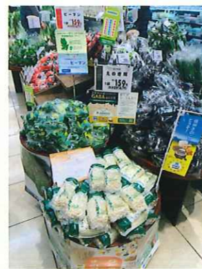
九州屋でのコラボ販売

消費者に対して保健機能食品をPRする良い機会となりました。今後も認知度向上を目指して、みやざきブランド推進本部と連携しながら、このような取組を浸透させていきたいです。