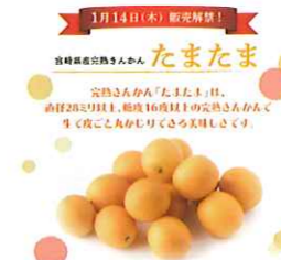
●1/14(木) 解禁●宮崎県産完熟きんかん「たまたま」 イオン九州アプリによる販売告知