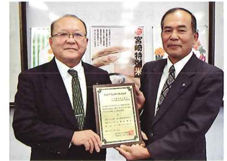
産地認定証交付式

私たちの産地では、きれいな水と朝夕の温度差で美味しいお米ができます。高齢の生産者が多い地域ですが、今回の認定は中山間地域の励みになります。この取組が新たなブランドとして定着すると嬉しいです。 商品はふるさと納税の返礼品やネット販売によりご提供しております。 ぜひ、ご賞味ください。