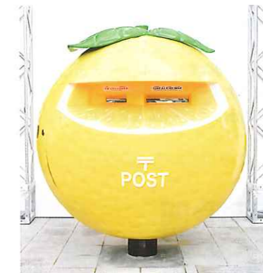
宮崎駅高千穂口前広場の日向夏ポスト

昨年11月にJR宮崎駅前広場に、商業施設「アミュプラザ」のオープンに合わせ「日向夏ポスト」を設置しました。日向夏発見200年を記念し、宮崎のソウルフルーツである日向夏をPRするもので、鮮やかな黄色が映えるポストです。この日向夏ポストから、大切な人へ想いを届けてみませんか。