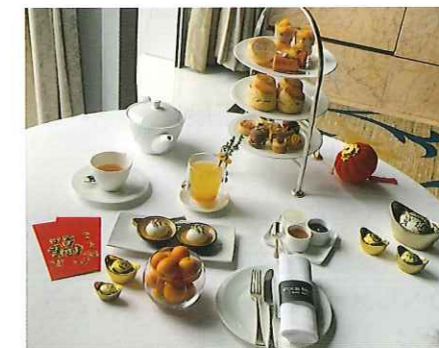
香港「宮崎キンカンアフタヌーンティー」