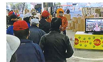
「たまたま」解禁日の市場での動画PR

香港の5つ星ホテル「フォーシーズンズホテル」では「宮崎キンカンアフタヌーンティー」が提供され、海外でも「たまたま」の魅力が広がっています。