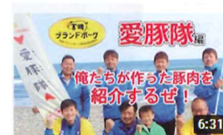
宮崎ブランドポーク個別銘柄紹介#1【愛豚隊】

現在、「愛豚隊」と「観音池ポーク」の動画を公開しており、他の個別銘柄の動画も随時アップしていきます。是非ご覧いただき、チャンネル登録もよろしくお願いいたします!