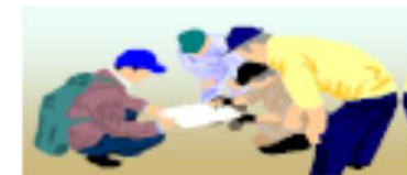
所有者立会いによる境界明確化