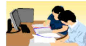
情報の収集・整理