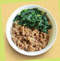
シカ肉の そばろ丼