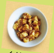
イノシシ肉の 麻婆豆腐