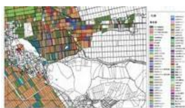
デジタルマップ策定